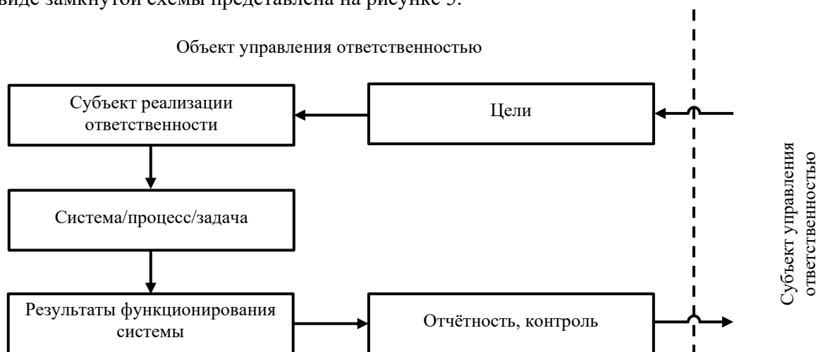
Рисунок 5 – Замкнутый цикл реализации ответственности как обязательства субъекта отчитываться за свои действия

Реализация ответственности в виде обязательства субъекта отчитываться за свои действия, принимать вину за последствия, обязанность отвечать за поступки и результаты в виде замкнутой схемы представлена на рисунке 5.