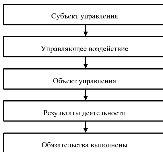
Рисунок 3 – Схема управления ответственностью по У. Кентону

Так, в работе 10 применительно к банковской сфере У. Кентон управление ответственностью определил как процесс управления со стороны субъекта использованием активов и денежных потоков для снижения риска убытков фирмы из-за несвоевременной оплаты обязательства. Общая схема такой формулы управления ответственностью приведена на рисунке 3.