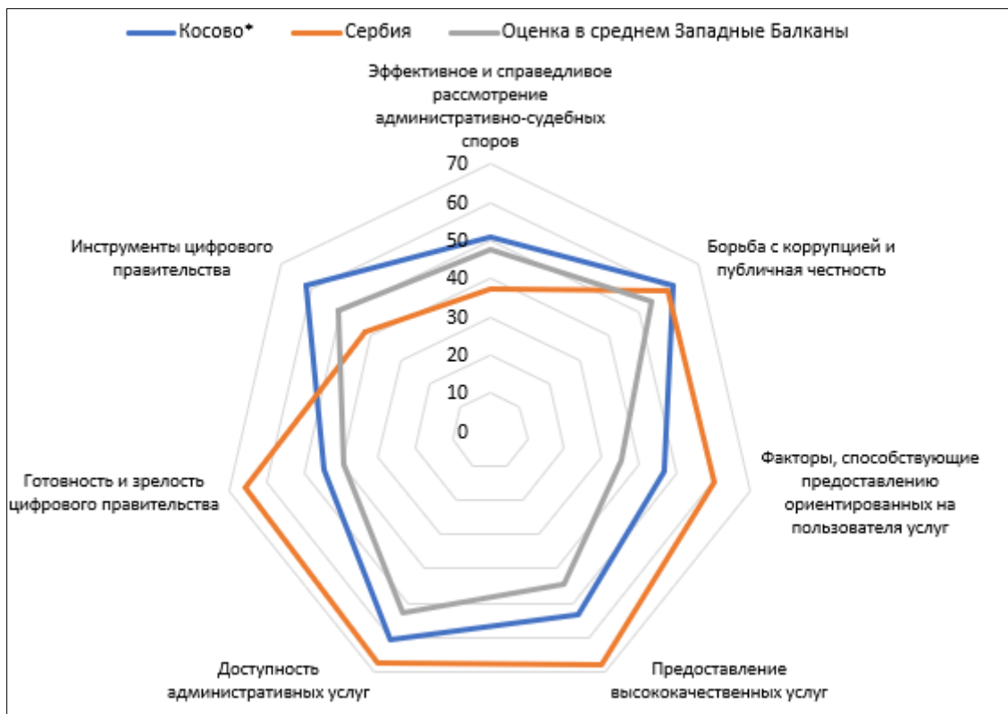
Рисунок 4 – Сравнительные данные реализации принципов SIGMA в части реформ государственных услуг в 2024 году, % Figure 4 – Comparative data on the implementation of SIGMA principles in terms of public service reforms in 2024, %