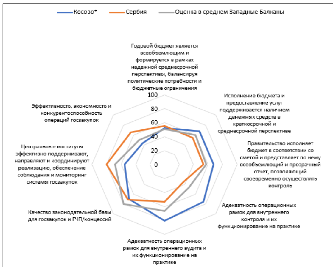
Рисунок 5 – Сравнительные данные реализации принципов SIGMA в части экономических реформ в 2024 году, % Figure 5 – Comparative data on the implementation of SIGMA principles in terms of economic reforms in 2024, %

Данные по блоку показателей оценки «государственных услуг» демонстрируют наиболее разделение ролей между двумя государственными системами. Сербия уверенно лидирует в сервисной и цифровой трансформации, ориентированной на конечного пользователя, тогда как Косово сохраняет преимущество в институциональных механизмах борьбы с коррупцией и технической оснащённости, но проигрывает в качестве и доступности услуг. Факторы, способствующие ориентированности на пользователя (46,8 % у Косово против 60,5 % у Сербии) показывает её лидерство по созданию условий для клиентоцентричности. Косово демонстрирует по показателям рост немного выше среднего, что указывает на недостаточное внимание к потребностям граждан при проектировании услуг (рисунок 4).