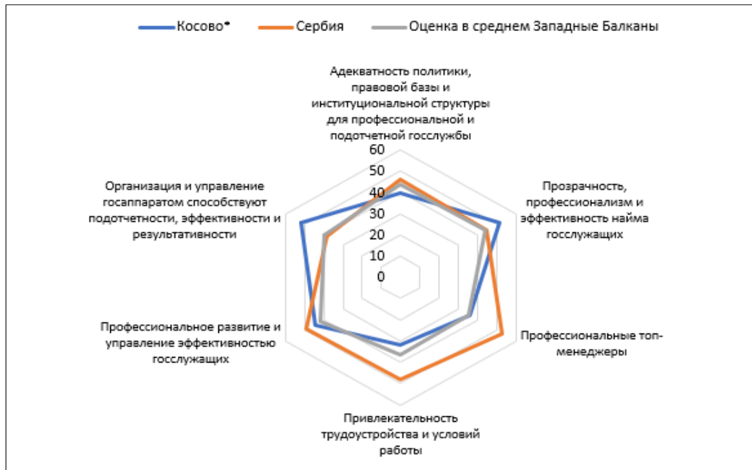
Рисунок 3 – Сравнительные данные реализации принципов SIGMA в части реформ государственной службы в 2024 году, % Figure 3 – Comparative data on the implementation of SIGMA principles in terms of civil service reforms, %