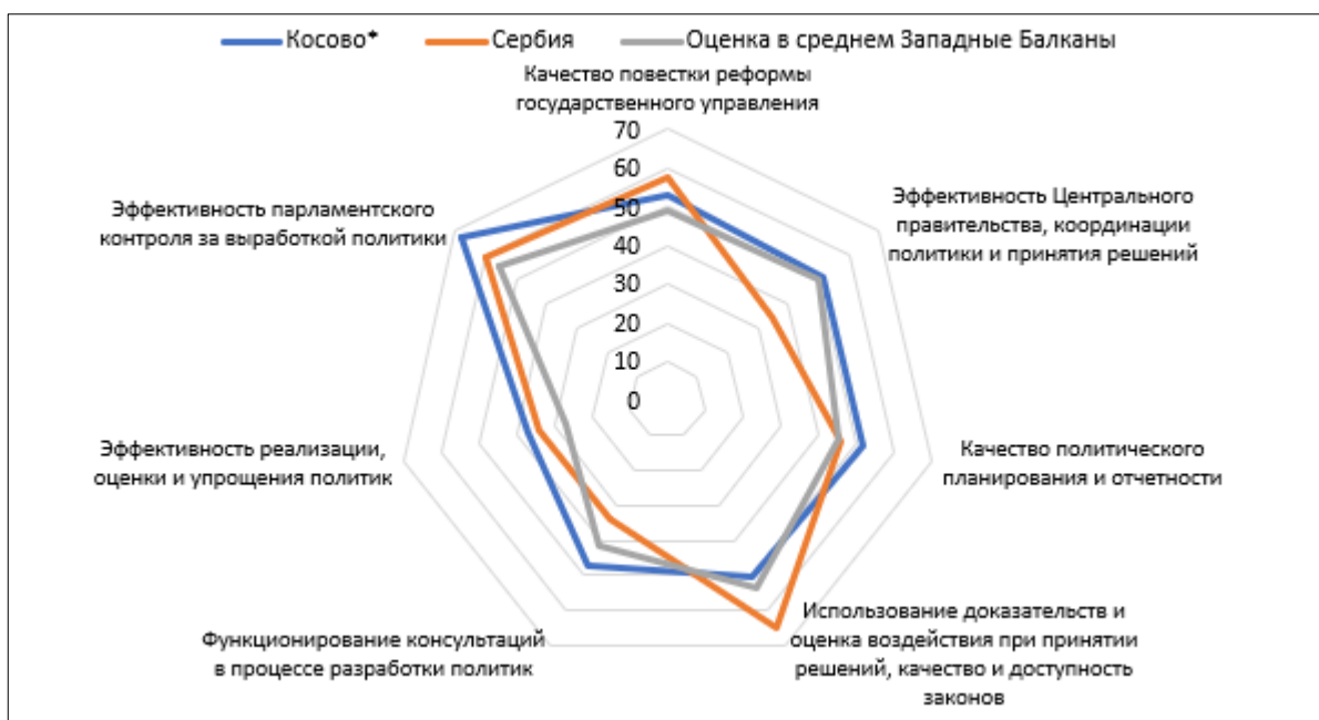
Рисунок 2 – Сравнительные данные реализации принципов SIGMA в части реформ государственного управления в 2024 году, % Figure 2 – Comparative data on the implementation of SIGMA principles regarding public administration reforms in 2024, %

Обе территории демонстрируют результаты выше среднего по ряду ключевых показателей, однако их профили эффективности диаметрально противоположны. Косово сильнее в институциональном надзоре и формальном планировании, тогда как Сербия лидирует в аналитической глубине и качестве законодательства, но испытывает кризис координации на высшем уровне. Косово является лидером региона по показателю «парламентский контроль» (Косово – 68,1 %, Сербия – 59,8 %), что подтверждает тезис о развитости внешних надзорных институтов. Данный показатель в Сербии выше среднего, что указывает на функционирующие механизмы законодательного надзора в обеих системах. Показатель эффективности правительства (51,5 % против 34,8 % у Сербии) является критически низким для Сербии, это худший показатель в представленной выборке, указывающий на серьёзные сбои в межведомственной координации и процессе принятия решений на высшем уровне. Косово, напротив, демонстрирует здесь относительную стабильность (выше среднего) (рисунок 2).